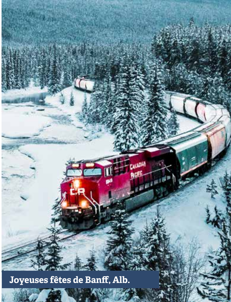
Joyeuses fêtes de Banff, Alb.

Le plus souvent, la couleur cruciale est la combinaison qui nécessite le plus de travail.