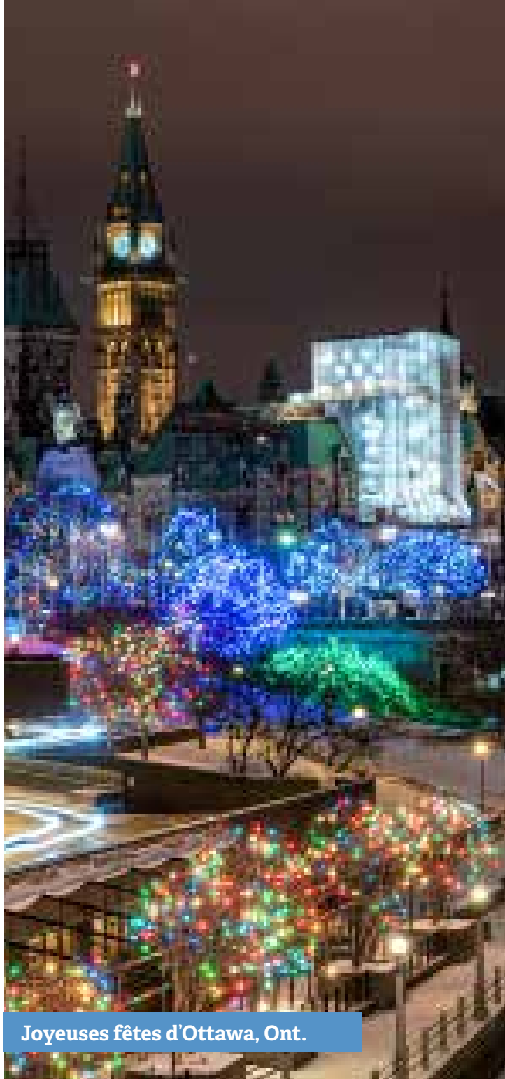
Joyeuses fêtes d'Ottawa, Ont.